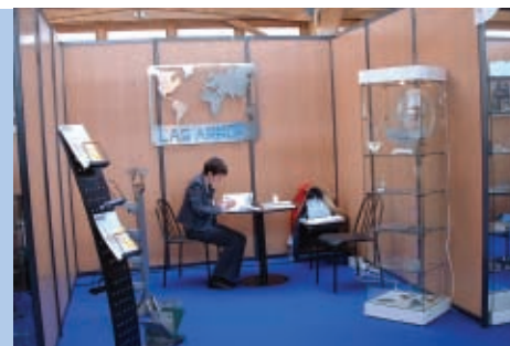
Stand type de 9 m 2